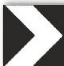
F.468 DELINEATORE MODULARE CURVA