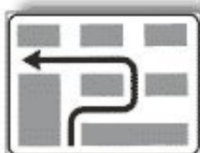
F.325 SVOLTA A SINISTRA SEMIDIRETTA