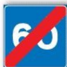
F.313 FINE VELOCITÀ CONSIGLIATA