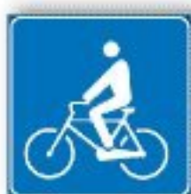
F.324 ATTRAVERSAMENTO CICLABILE