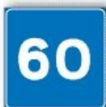
F.312 VELOCITÀ CONSIGLIATA