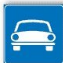
F.314 STRADA RISERVATA AI VEICOLI A MOTORE