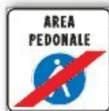
F.321 FINE AREA PEDONALE