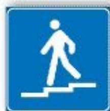
F.306 SOTTOPASSAGGIO PEDONALE