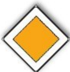
F.44 DIRITTO DI PRECEDENZA