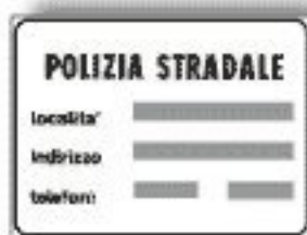
F.378 POLIZIA STRADALE