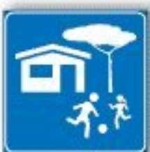
F.318 ZONA RESIDENZIALE