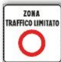
F.322/a1 ZONA A TRAFFICO LIMITATO