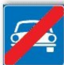
F.315 FINE STRADA RISERVATA AI VEICOLI A MOTORE