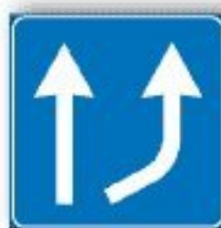
F.342 VARIAZIONE CORSIE DISPONIBILI