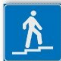
F.307 SOTTOPASSAGGIO PEDONALE