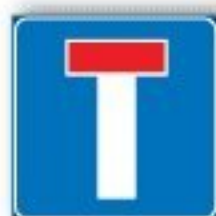
F.309 STRADA SENZA USCITA