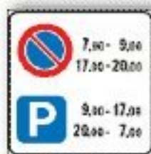
F.79/4 REGOLAZIONE FLESSIBILE SOSTA IN CENTRO ABITATO