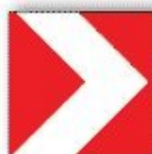
F.395 DELINEATORE MODULARE CURVA PROVVISORIA