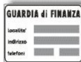
F.381 GUARDIA DI FINANZA