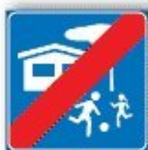
F.319 FINE ZONA RESIDENZIALE