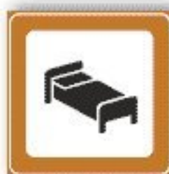
F.299 INFORMAZIONI ALBERGHIERE