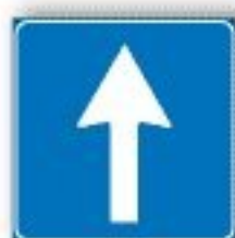
F.349 SENSO UNICO FRONTALE