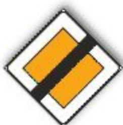
F.42 FINE DEL DIRITTO DI PRECEDENZA