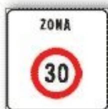
F.323/a ZONA A VELOCITÀ LIMITATA