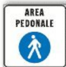
F.320/a AREA PEDONALE