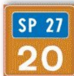
F.375 NUMERAZIONE DEI CAVALCAVIA