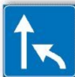
F.341 VARIAZIONE CORSIE DISPONIBILI