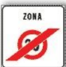
F.323/b FINE ZONA A VELOCITÀ LIMITATA