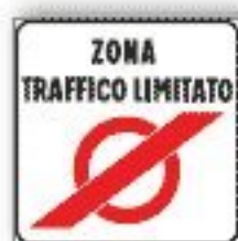
F.322/b FINE ZONA A TRAFFICO LIMITATO