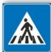
F.303 ATTRAVERSAMENTO PEDONALE