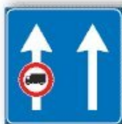
F.337 USO CORSIE