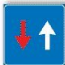
F.45 DIRITTO DI PRECEDENZA NEI SENSI UNICI ALTERNATI