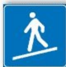
F.308 RAMPA INCLINATA PEDONALE