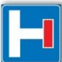
F.311 PREAVVISO STRADA SENZA USCITA