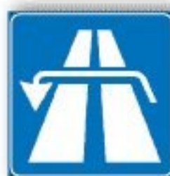
F.327 INVERSIONE DI MARCIA