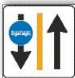
F.339 USO CORSIE