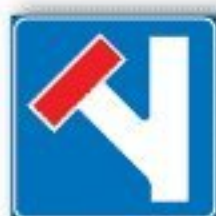
F.310 PREAVVISO STRADA SENZA USCITA