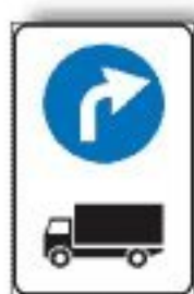
M.8/c PREAVV. DEVIAZIONE OBBL. AUTOCARRI IN TRANSITO