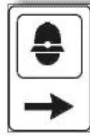
F.284 POLIZIA MUNICIPALE