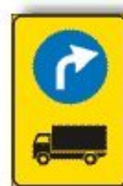
F.409/a PREAVVISO DEVIAZ. AUTOCARRI OBBLIGATORIA