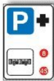
F.368 PARCHEGGIO PIÙ SCAMBIO BUS