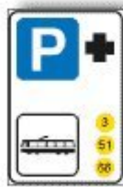
F.369 PARCHEGGIO PIÙ SCAMBIO TRAM