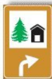
F.361 OSTELLO PER LA GIOVENTÙ