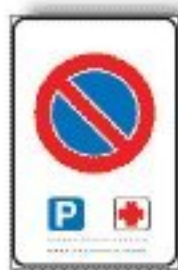
F.79/b SOSTA CONSENTITA A PARTICOLARI CATEGORIE