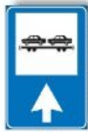
F.372 AUTO SU TRENO