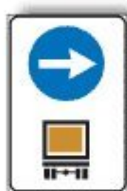
M.8/b ITINERARIO OBBLIGATORIO MERCI PERICOLOSE