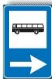
F.358 FERMATA AUTOBUS