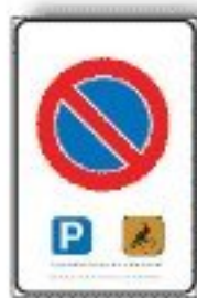
F.79/a SOSTA CONSENTITA A PARTICOLARI CATEGORIE