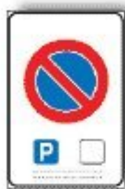
F.79/c SOSTA CONSENTITA A PARTICOLARI CATEGORIE