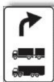
F.350 PREAVVISO DEVIAZ. CONSIGLIATA AUTOCARRI