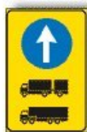
F.409/b DIREZIONE AUTOCARRI OBBLIGATORIA