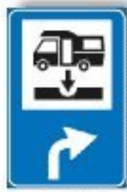
F.377 AREA ATTREZZATA CON IMPIANTI DI SCARICO