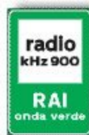
F.364 RADIO INFORMAZIONI STRADALI