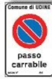
F.78 PASSO CARRABILE