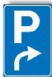
F.77 PREAVVISO DI PARCHEGGIO