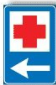
F.353 PRONTO SOCCORSO