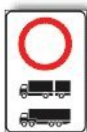
M.8/d DIVIETO DI TRANSITO AUTOCARRI