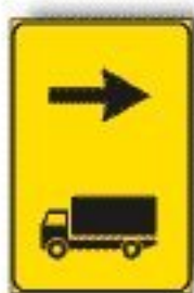
F.410/b DIREZIONE AUTOCARRI CONSIGLIATA