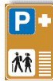
F.371 PARCH. DI SCAMBIO PER ITINERARI TURISTICI A PIEDI