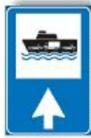
F.374 AUTO SU NAVE