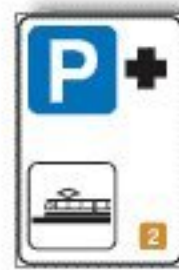
F.370 PARCH. DI SCAMBIO METRO O ALTRI SERV. EXTRAURB. SU ROTAIA