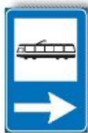
F.359 FERMATA TRAM