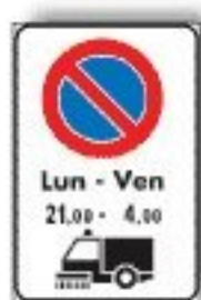
M.8/a DIVIETO DI SOSTA TEMPORANEO