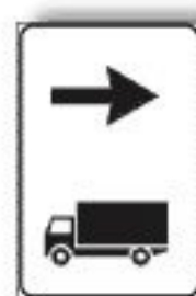
F.351 DIREZIONE AUTOCARRI CONSIGLIATA