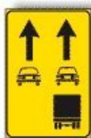
F.414 USO CORSIE DISPONIBILI