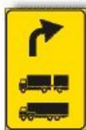
F.410/a PREAVVISO DEVIAZIONE AUTOCARRI CONS.