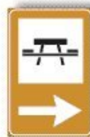
F.362 AREA PIC NIC