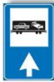
F.373 AUTO AL SEGUITO