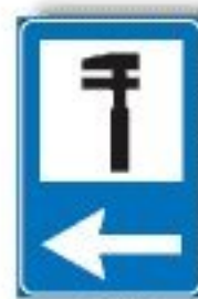
F.354 ASSISTENZA MECCANICA