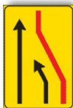
F.411/a CORSIA CHIUSA DI DESTRA