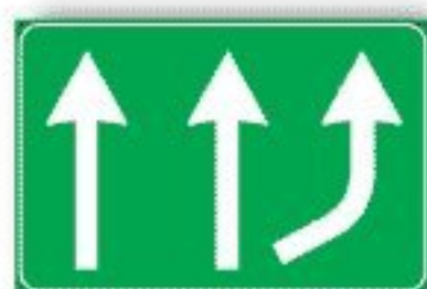
F.344 VARIAZIONE CORSIE DISPONIBILI