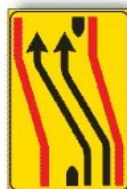
F.413/b CARREGGIATA CHIUSSA