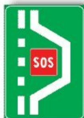
F.329 PIAZZOLA PIÙ SOS AUTOSTRADALE