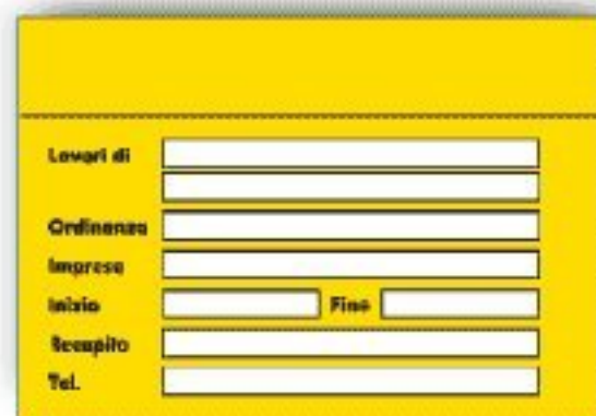
F.382 TABELLA LAVORI