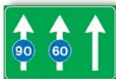
F.338 USO CORSIE