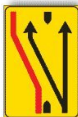
F.411/c CORSIE CHIUSSO