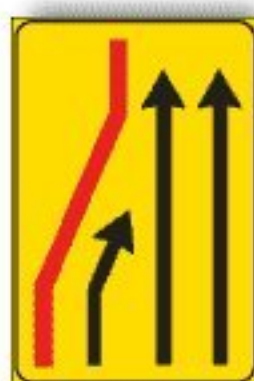
F.411/ba CORSIA CHIUSA DI SINISTRA