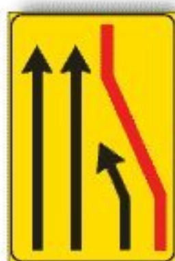
F.411/ba CORSIA CHIUSA DI DESTRA