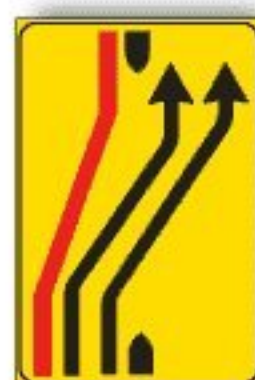
F.413/c RIENTRO IN CARREGGIATA