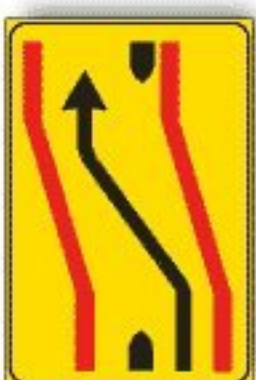
F.412/a CARREGGIATA CHIUSSA