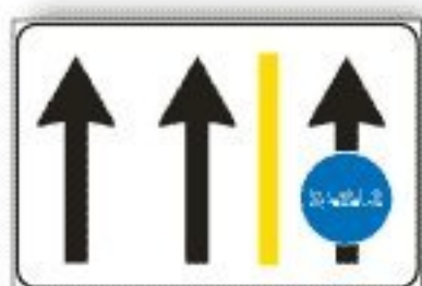
F.340 USO CORSIE