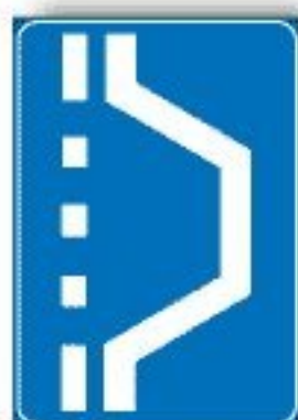
F.328 PIAZZOLA SU VIABILITÀ ORDINARIA