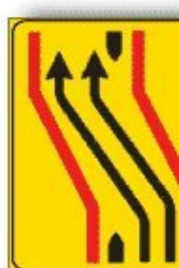
F.413/a CARREGGIATA CHIUSSA