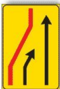
F.411/aa CORSIA CHIUSA DI SINISTRA