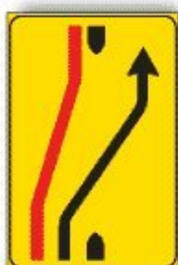
F.412/b RIENTRO IN CARREGGIATA