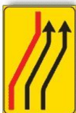
F.411/d CORSIE CHIUSSO