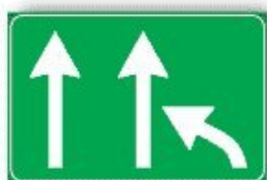
F.343 VARIAZIONE CORSIE DISPONIBILI